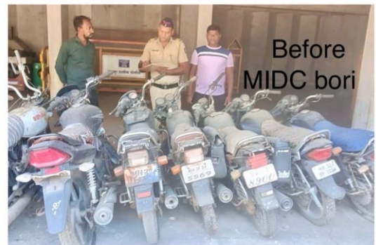
Before MIDC bori