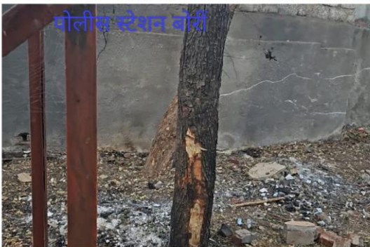
पोलीस स्टेशन बोरी