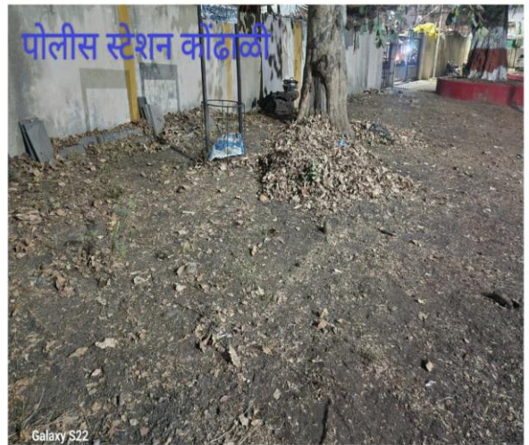
पोलीस स्टेशन कोंढाळी