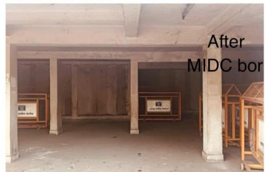
After MIDC bor