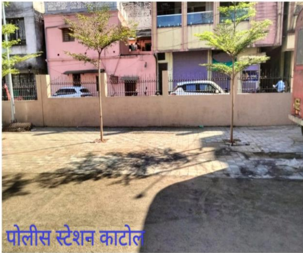
पोलीस स्टेशन काटोल